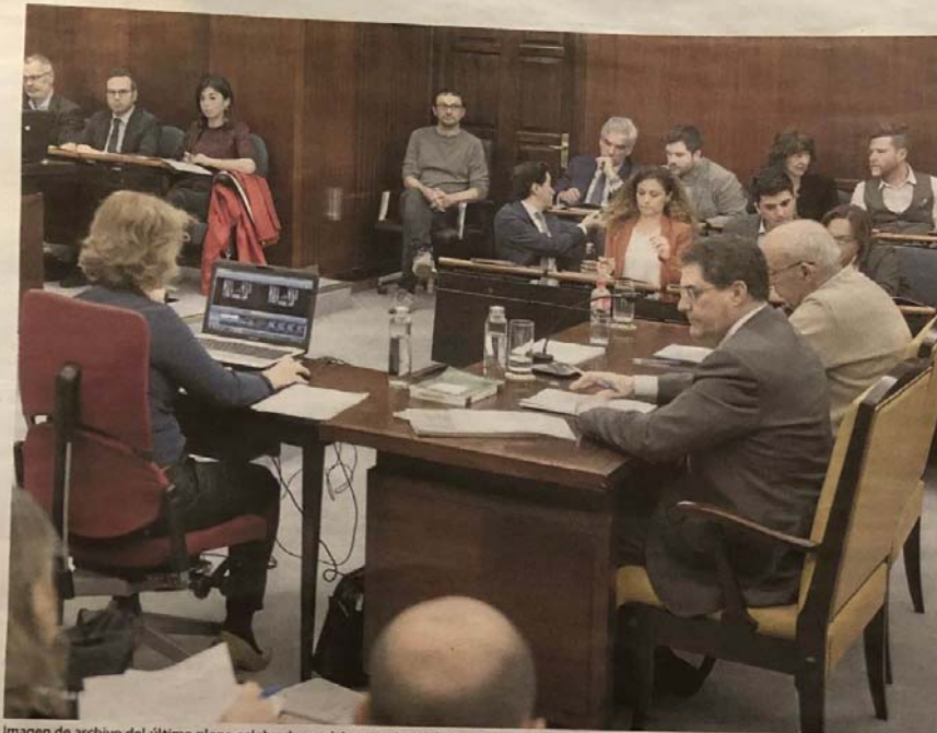
Imagen de archivo del último pleno celebrado en el Ayuntamiento de Santander. DANIEL PEDRIZA